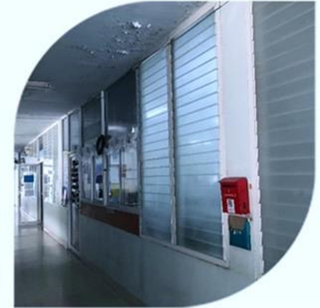
บริเวณทางเดินผู้ป่วยใน (IPD)